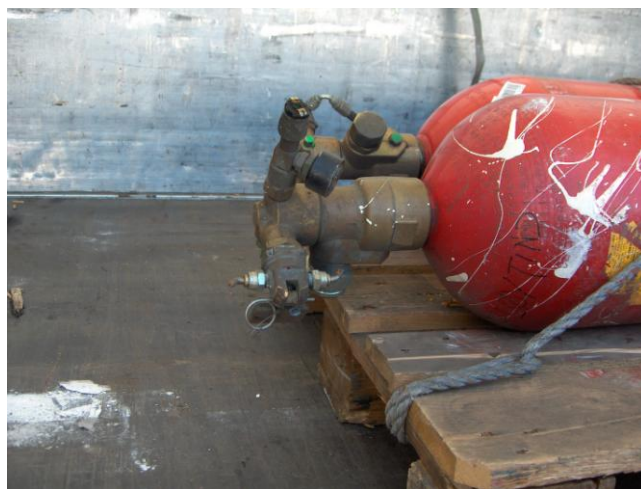
Bildet 5. Ubeskyttede ventiler.