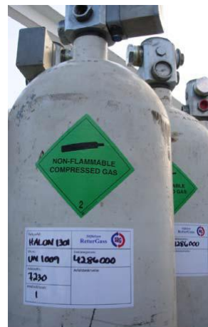
Bildet 2 og 3. Riktig merking og pakking av halonsylindere.