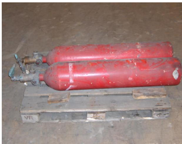
Bildet 4. Løse sylindere liggende på en pall.