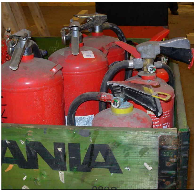
Bildet 6. Riktig pakking av håndslukkere.

Ved innlevering av håndslukkere skal disse pakkes på paller med pallekarmer hvor håndslukkerne skal stå oppreist. Om nødvendig kan pallene stables i høyden, men påse da at det er god klaring mellom etasjene slik at ventilene/koblingene ikke avløses.